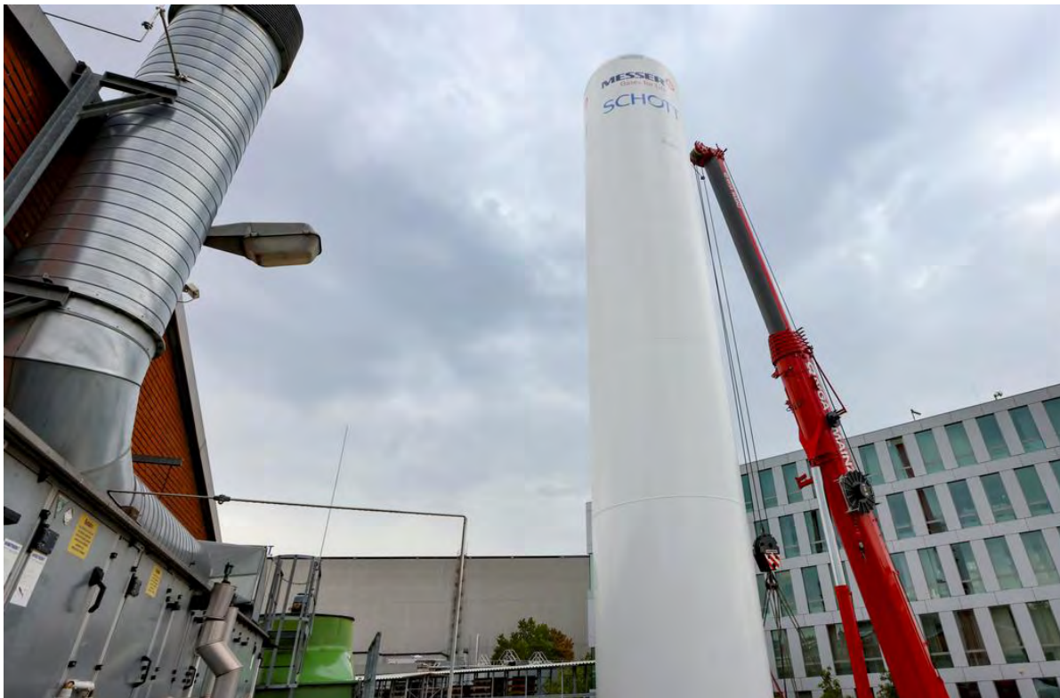
Montage des Wasserstofftanks für Glasschmelzversuche bei der Firma SCHOTT AG

Auch die direkte energetische Nutzung durch Verbrennung kann fossile Brennstoffe ersetzen, um etwa Prozesswärme zu erzeugen oder Wasserstoffverbrennungsmotoren anzutreiben. So erfolgt bereits heute die Beimischung von Wasserstoff in das Erdgasnetz zur Erzeugung von Wärme und elektrischem Strom. Weiterhin ist Wasserstoff in Fahrzeugen, die mit Brennstoffzellen oder geeigneten Verbrennungsmotoren angetrieben werden, einsetzbar.