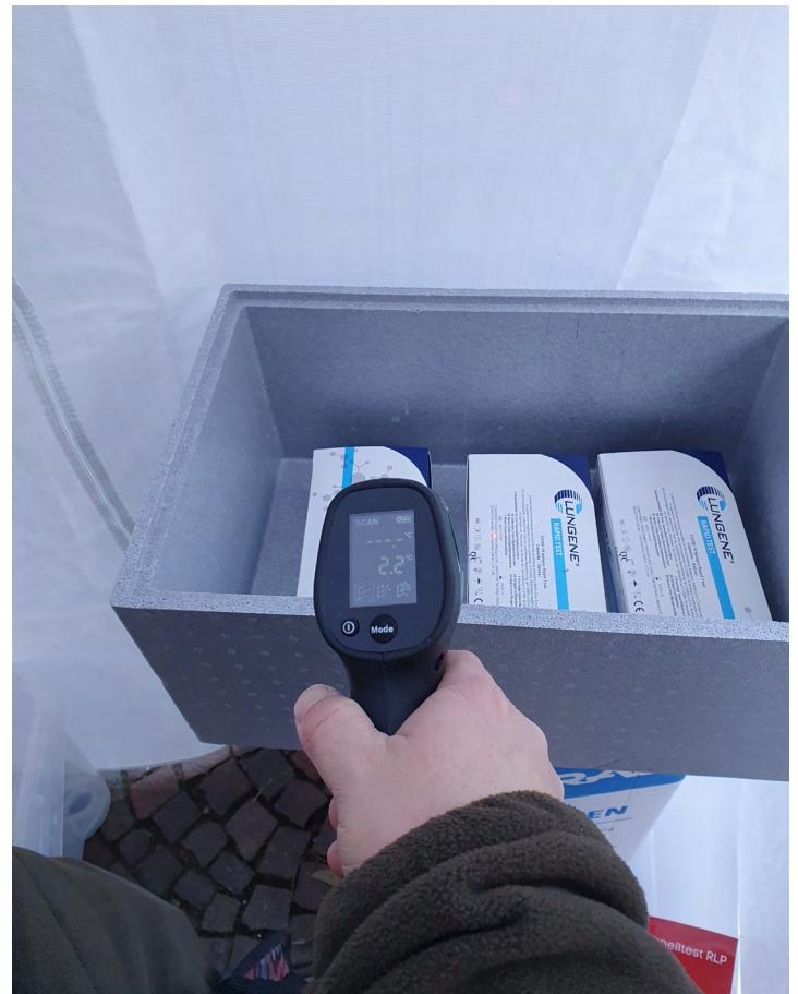
Corona-Teststelle in einem Pavillon mit einer Innentemperatur von ca. 2 °C

Besonders in den Wintermonaten zwischen November 2021 und März 2022 wurde der Schwerpunkt der Inspektionen auf die Temperaturen an den Arbeitsplätzen der Mitarbeitenden und die Lagerung der Antigen-Schnelltests gelegt.