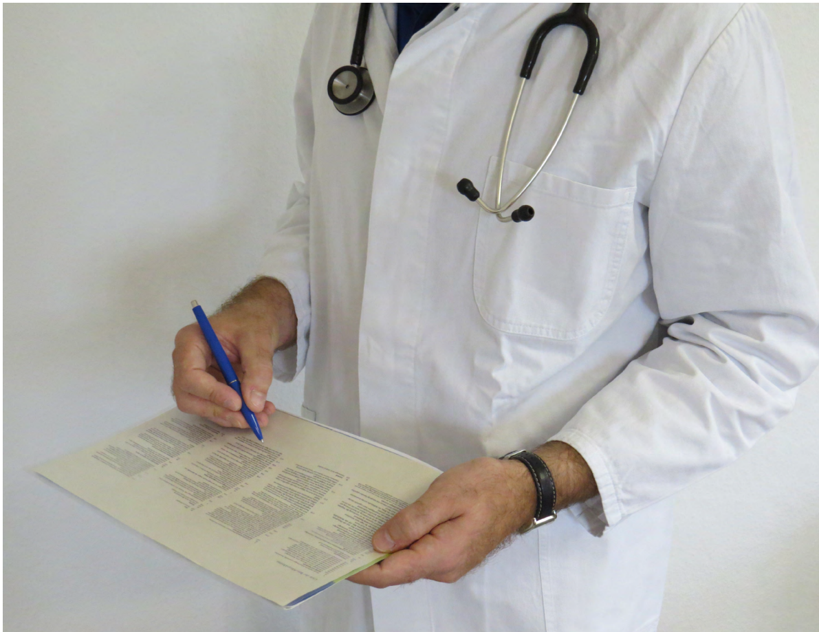
Gewerbearzt mit Kontrollblatt und Stethoskop

Dieser starke Anstieg ist auf die Coronapandemie und die damit in Zusammenhang stehende hohe Zahl an beruflich bedingten Covid-19-Erkrankungen zurückzuführen. Covid-19 ist bei Versicherten im Gesundheitsdienst, in der Wohlfahrtspflege, in einem Laboratorium oder bei einer anderen Tätigkeit mit Infektionsgefahr in ähnlichem Maße grundsätzlich als BK anerkennungsfähig.