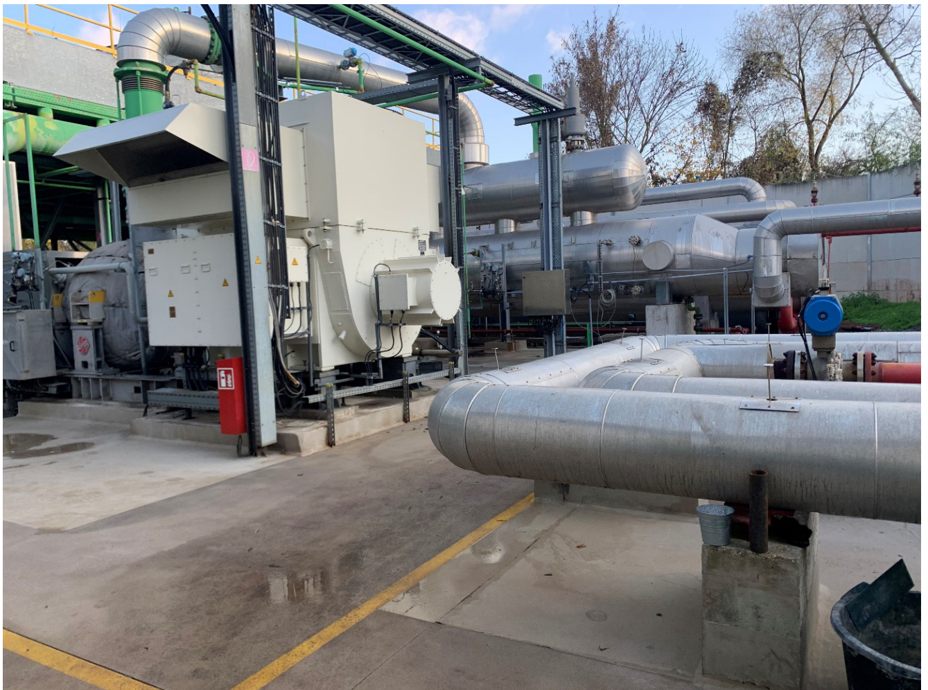
Dampfturbine mit Stromgenerator der Geothermieanlage der Fa. GEOX in Landau

Je nach Tiefenlage zwischen 2.000 m bis 7.000 m liegen hier Thermalwassertemperaturen von 80 °C bis 160 °C vor, was ein enormes Energiepotenzial birgt. Das Thermalwasser im Oberrheingraben weist zudem einen recht hohen Lithiumgehalt von durchschnittlich 180 mg/l auf.