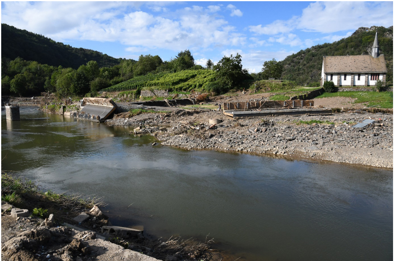
Durch die Flut zerstörte Brücke im Ortsteil Altenahr-Altenburg

So waren zum Beispiel viele Wohn- und Geschäftsimmobilien in den vom Hochwasser betroffenen Gebieten plötzlich ohne Wärmeversorgung. Auch zahlreiche Flüssiggastanks wurden von der Flut mitgerissen oder beschädigt. Daher mussten Sonderprüfungen an den sicherheitsrelevanten Einrichtungen initiiert werden. Zur Erarbeitung eines Schutzkonzeptes wurde seitens des Flüssiggasverbandes (Deutscher Verband Flüssiggas e. V.) eine Task Force eingerichtet, die sich mit einer abgestimmten Vorgehensweise zur schnellen, aber auch zukunftssicheren Wiederherstellung der Versorgung in den vom Hochwasser betroffenen Gebieten beschäftigte. Das Schutzkonzept wurde mit der Gewerbeaufsicht abgestimmt.